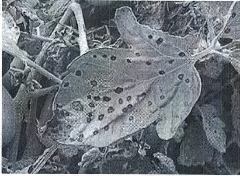
Atac pe frunze