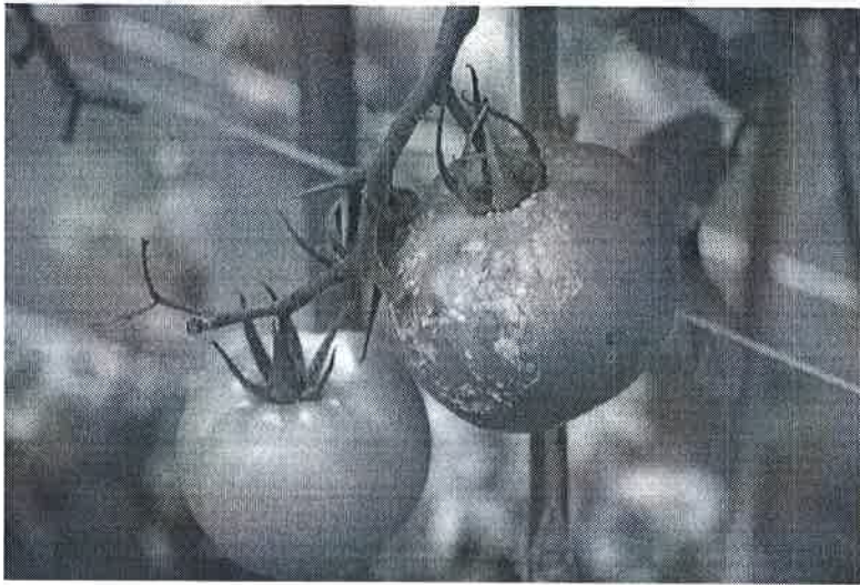
Atac pe fructe