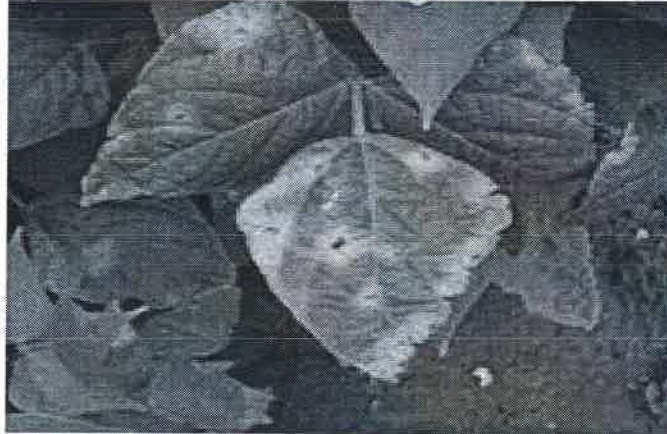
Bacterioza la fasole ( Xanthomonas campestris )