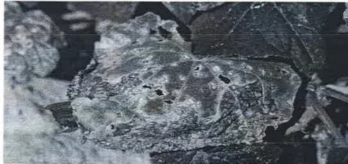
Patarea unghiulara a castravetilor

Este o boala pagubitoare si frecventa in culturile de castraveti in camp, cat si in cele din spatiile protejate.