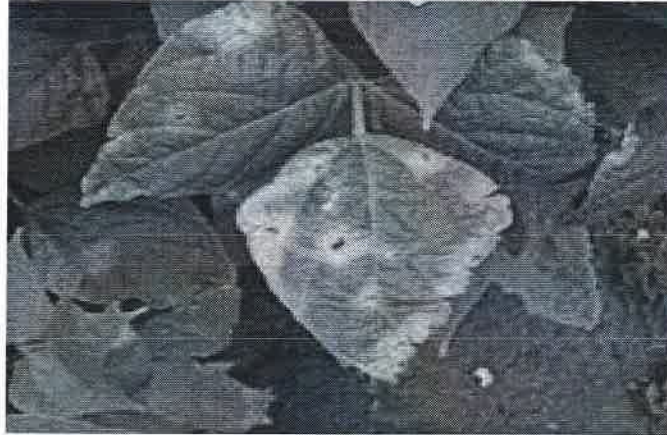
Bacterioza la fasole ( Xanthomonas campestris )