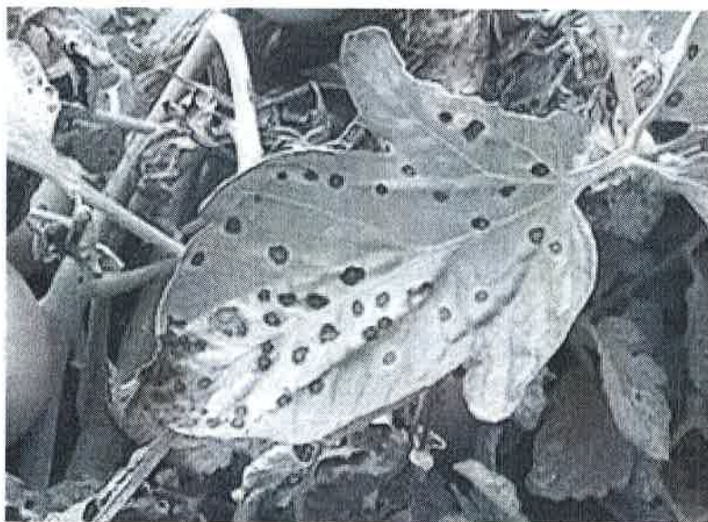
Atac pe frunze