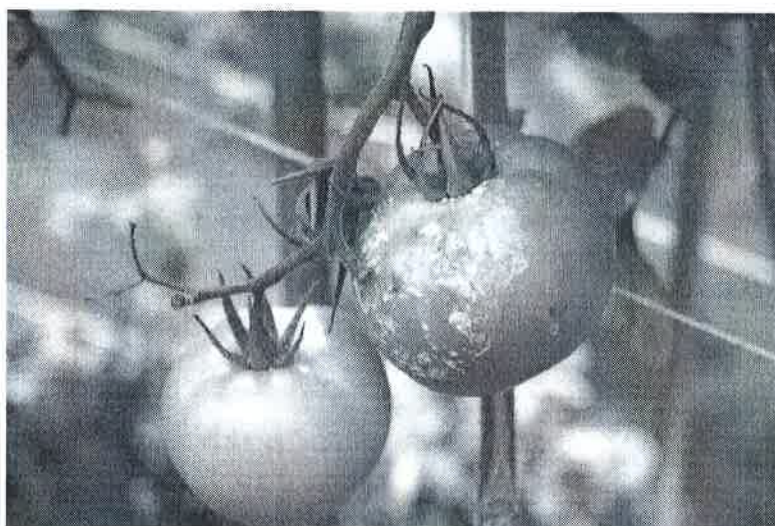
Atac pe fructe