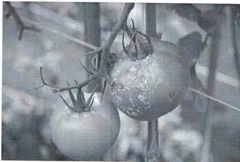
Atac pe fructe