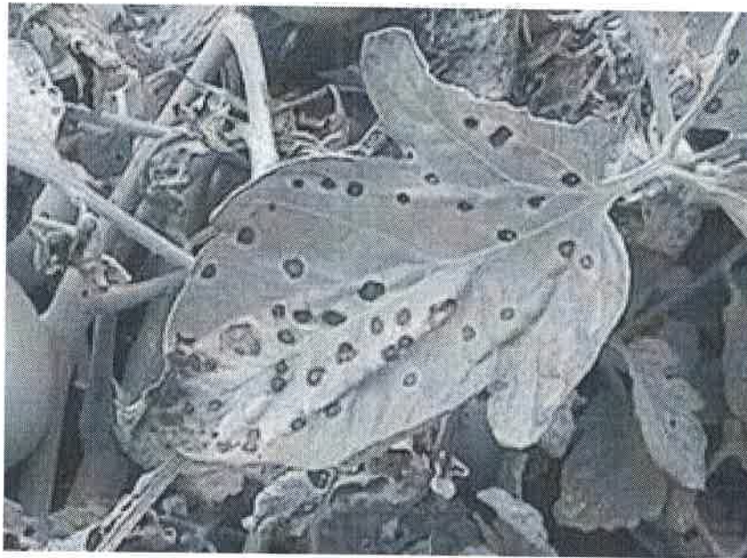
Atac pe frunze