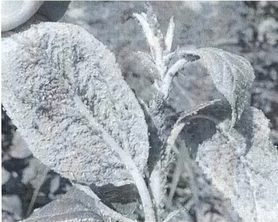
Afide la mar

Paduchii din San Jose ataca scoarta ramurilor, lastarii, tulpinile si abia apoi frunzele si fructele. Atacurile sunt realizate de catre larve si femele, care inteapa tesuturile pomilor pentru a se hrani, injectand totodata saliva cu enzime care afecteaza tesuturile. In jurul intepaturilor se formeaza o nuanta rosie sau rosie-vinetie care in cele din urma se necrozeaza si se usuca.