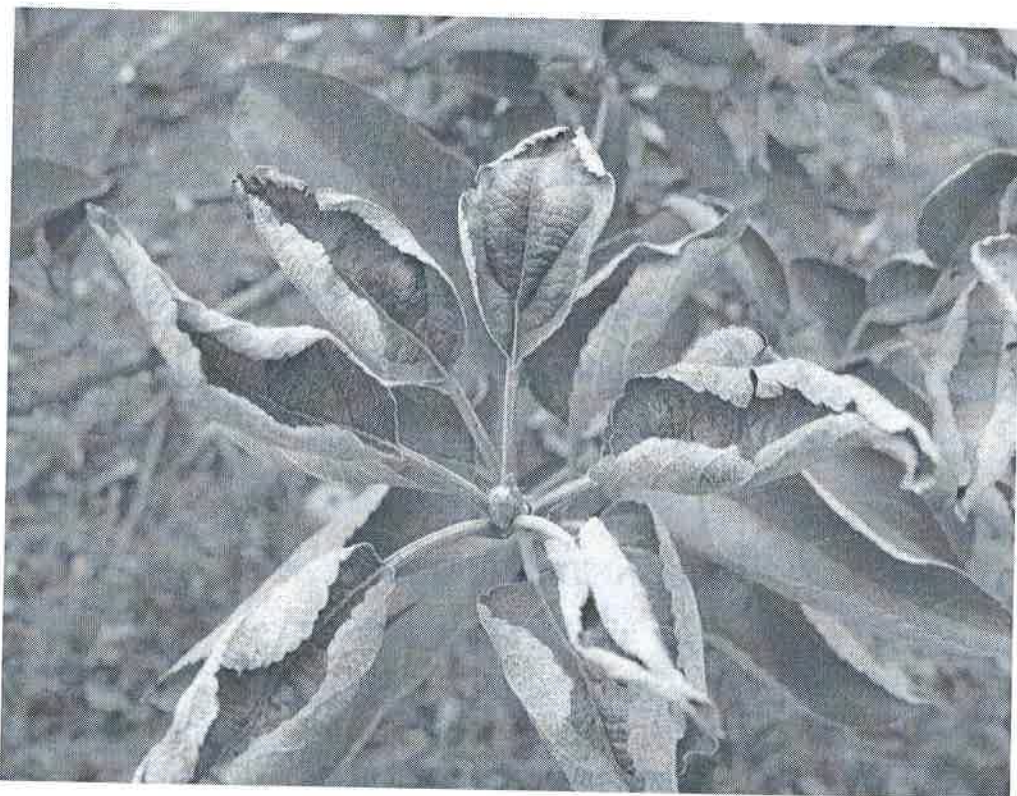
Fainare la măr