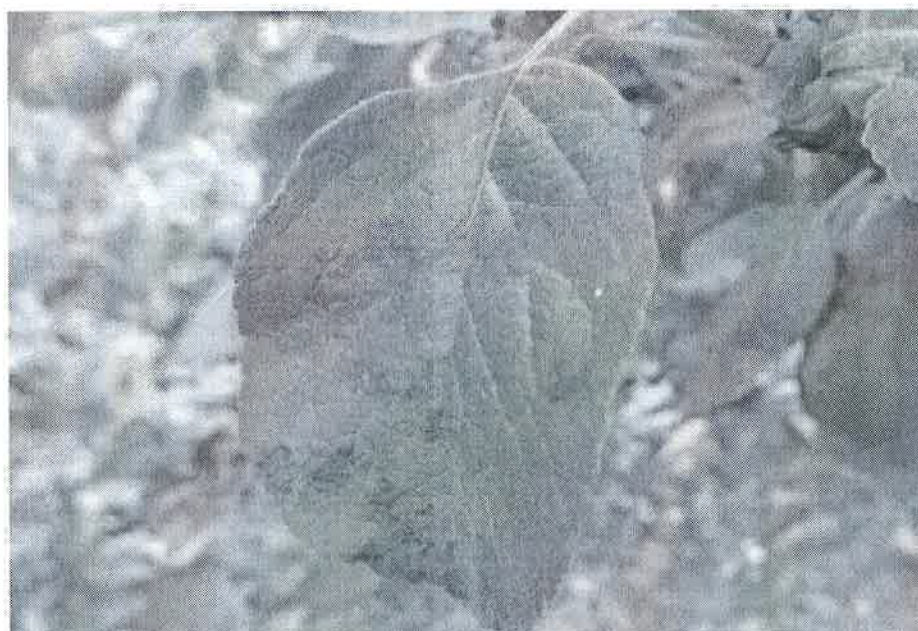
Rapan la măr

Paduchele din san Jose rapan, fainare, omizi defoliatoare, afide - la culturile de măr și par