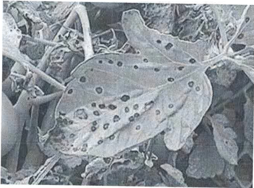
Atac pe frunze