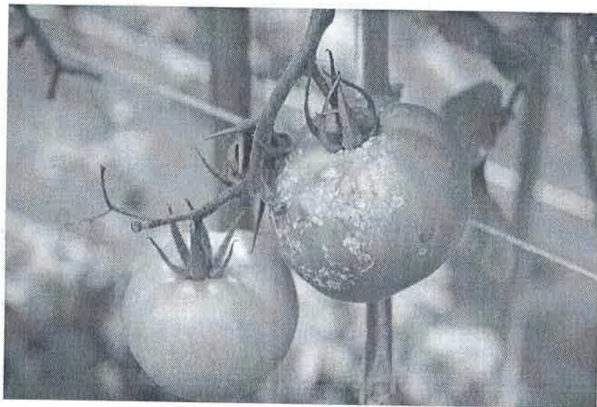
Atac pe fructe