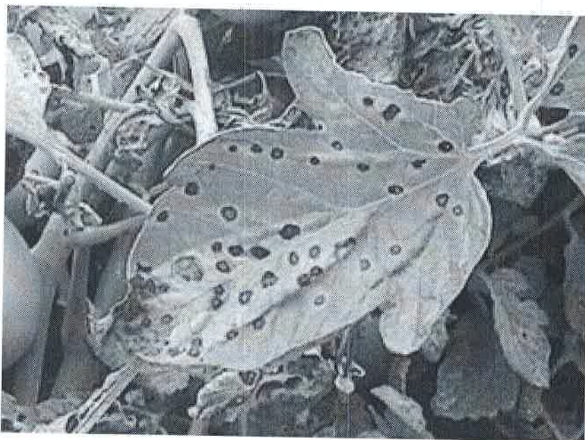
Atac pe frunze