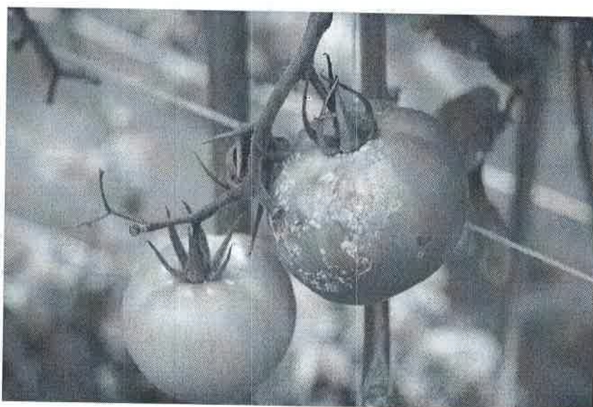
Atac pe fructe