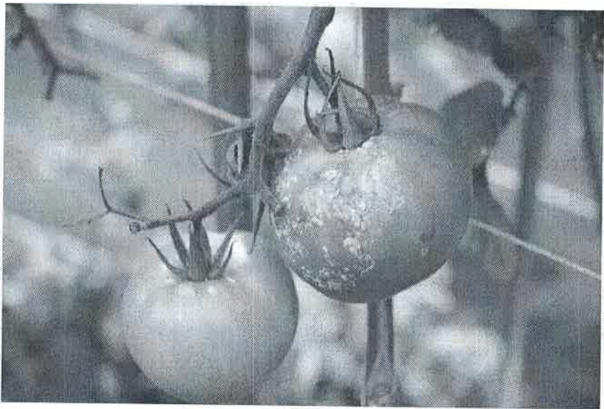
Atac pe fructe