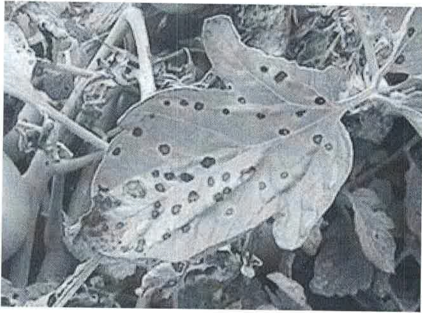
Atac pe frunze