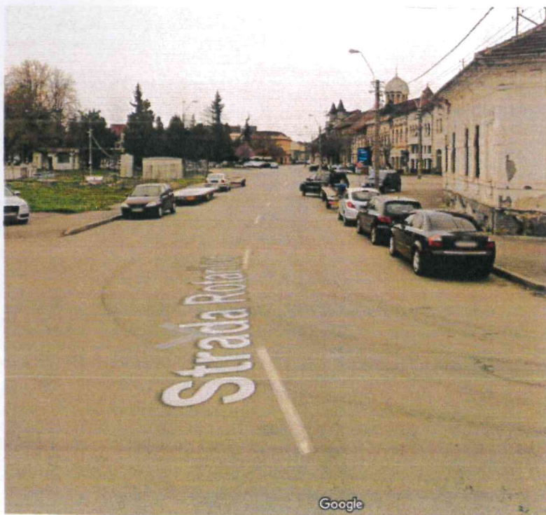
(Situatia existenta a carosabilului adiacent.)

- Infrastructura actuala este supradimensionata, prezentand un profil caracteristic de 11.47m in zona adiacenta amplasamentului studiat, permitand atat circulatia pe doua sensuri, cat si parcare de autovehicule.