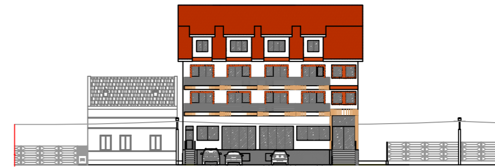
Profil longitudinal la strada sc.1:1000

Sistem de cote local Sistem de proiectie stereografic 1970