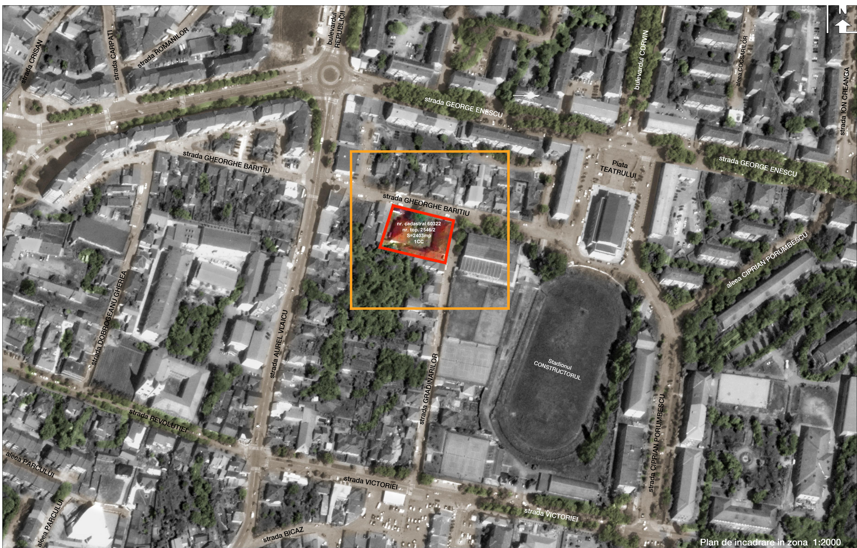
Plan de incadrare in zona 1:2000